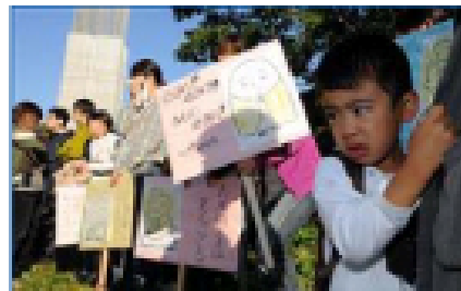
撤されていく畑を泣きながら見る園児たち＝16日午前8時12分、大阪府門真市

第二京阪道路 (京都市伏見区～大阪府門真市)の建設予定地に位置する北巣本保育園(門真市)の野菜畑を撤去する大阪府の行政代執行が16日早朝から始まった。保育園側は2週間後に近くの保育園と合同でこの野菜畑を使ったイモ掘り行事を控えており、職員ら約50人が「子供たちの野菜を奪わないで」と反対の声をあげたが、府は代執行を強行。園児らが育てた野菜を刈り取り、敷地の立ち入り禁止措置を取った。